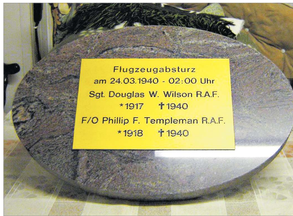
Ein Gedenkstein mit Tafel wurde für das Ereignis hergestellt. Beteiligt war daran auch die Beddelhäuser Steinmetzfirma Marburger.