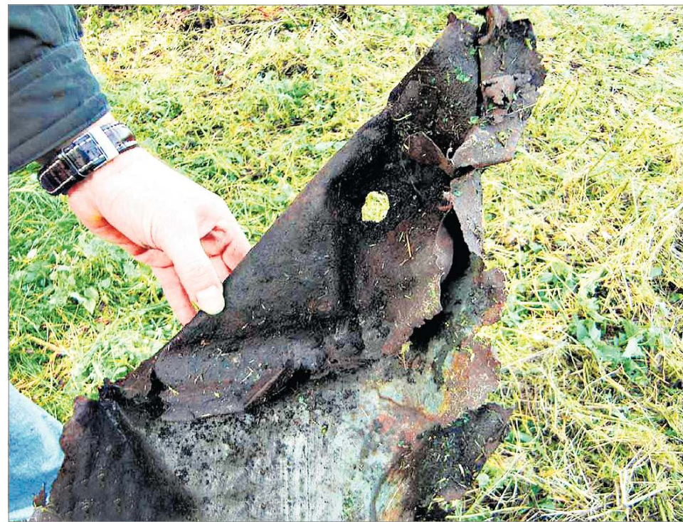
In Ganderkesee bei Delmenhorst fand man an der Absturzstelle ein Wrackteil mit zwölf Millimeter großem Einschussloch.